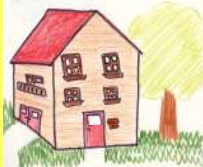
MAISON [mezõ] HIŠA