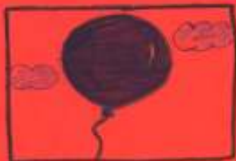
PHOTO Slika [foto]