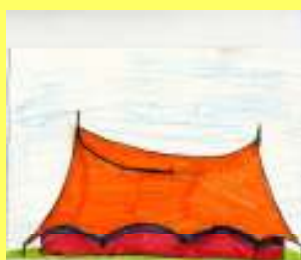
TENTE [tõnt] šotor